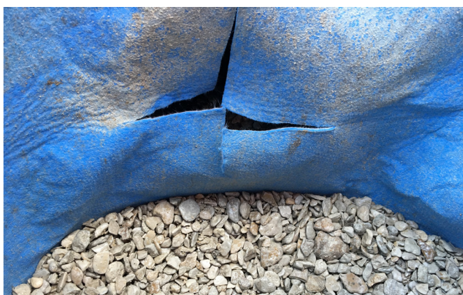
Figure 1: Découpe de l'aquatextile « en croix » pour le passage de la conduite

La conduite est ensuite poussée en force à travers cette découpe, de l'extérieur (face grise) vers l'intérieur (face bleue) de l'ouvrage. OSMORIA Geoclean se déforme et s'applique avec un contact parfait sur toute la périphérie de la conduite. Fixer les 4 angles d'aquatextile sur la conduite avec un collier de serrage inox.