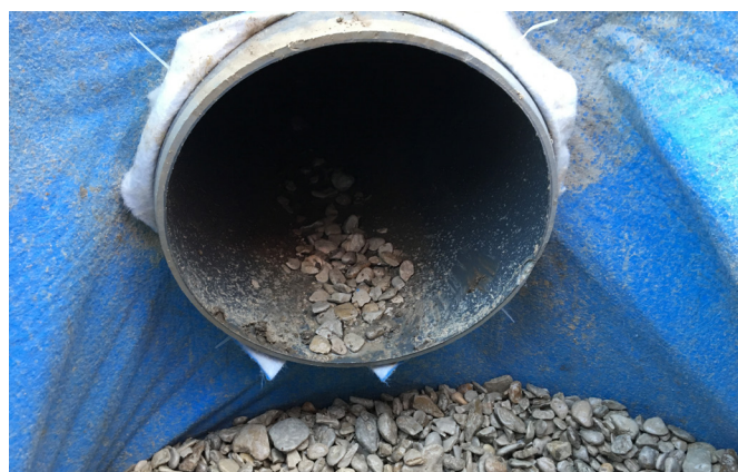
Figure 2: Traversée de l'aquatextile par la conduite dans la découpe

Il convient de s'assurer de la stabilité de la conduite à l'endroit de la traversée afin qu'elle ne transfère pas d'effort à l'aquatextile.