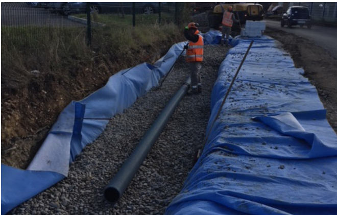
Figure 7: L'aquatextile emballe la couche granulaire incluant le drain d'injection, la face bleue est orientée vers le massif granulaire (amont de l'écoulement).

La présence d'un décanteur en amont de la tranchée est conseillée pour réduire la quantité des particules solides qui s'introduisent dans l'ouvrage enterré.