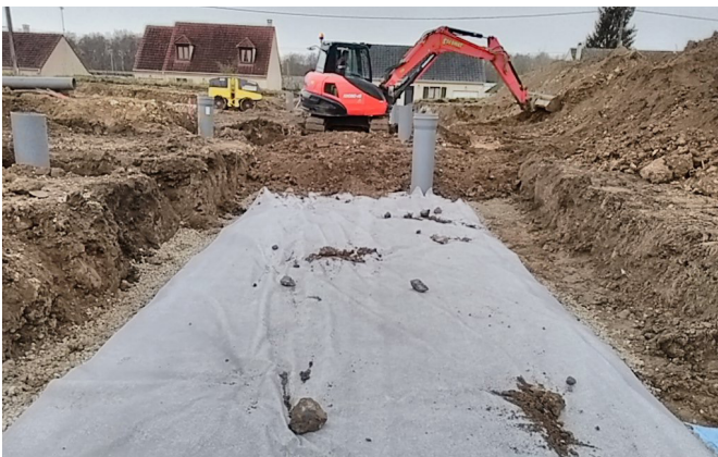
Figure 9: Couverture de l'ouvrage enterré avec un géotextile de séparation, en fin de remblaiement de la tranchée par le matériau granulaire