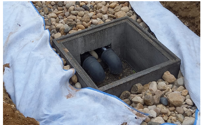
Figure 8: Recouvrement du dessus du massif granulaire par au moins 30 cm d'aquatextile, en attente d'une mise en place d'un géotextile de séparation