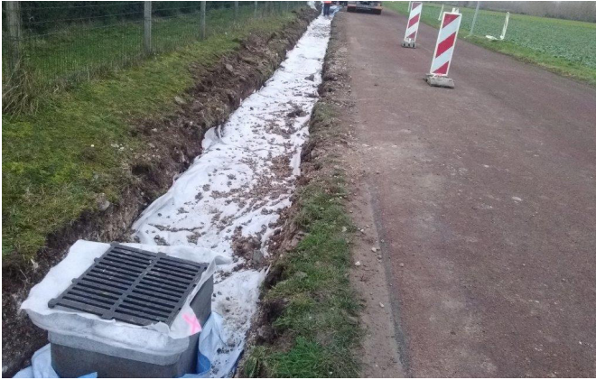
Figure 5: Couverture du massif granulaire par la sur-longueur de l'aquatextile laissée en attente