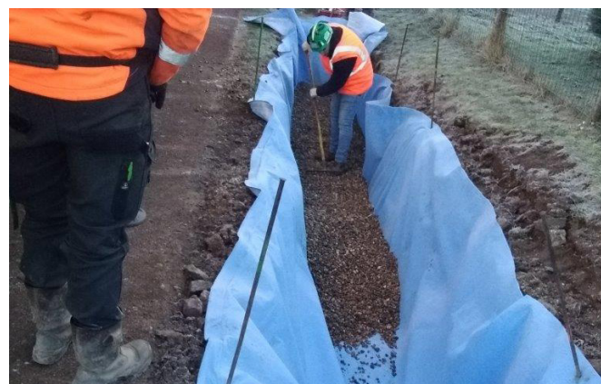
Figure 4: Remplissage progressif de la tranchée d'infiltration avec le matériau granulaire sélectionné selon les spécifications du projet