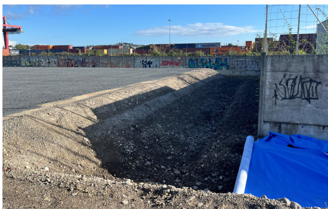
Figure 3: Installation de l'aquatextile OSMORIA Geoclean en fond et sur les parois de la tranchée d'infiltration

Le remblaiement sur le dessus de la tranchée d'infiltration est effectué soigneusement avec le matériau de couverture spécifié. Il pourra être compacté en cas de granulométrie fine.