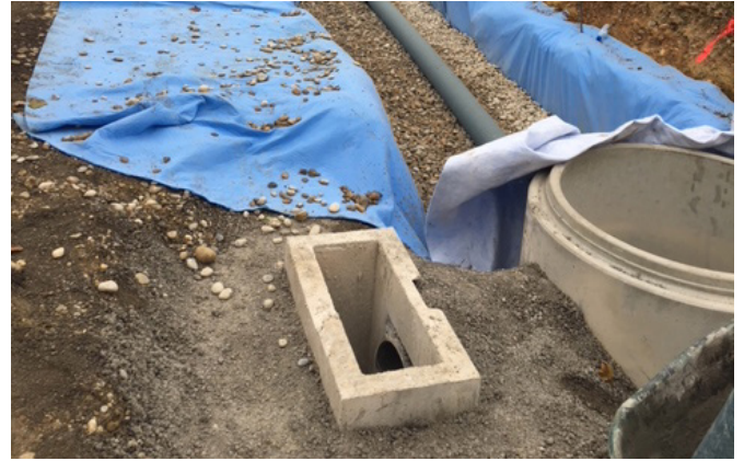
Figure 6: Puits d'injection pour collecter les eaux pluviales en surface et les injecter dans la tranchée d'infiltration.

La présence d'un décanteur en amont de la tranchée est conseillée pour réduire la quantité des particules solides qui s'introduisent dans l'ouvrage enterré.